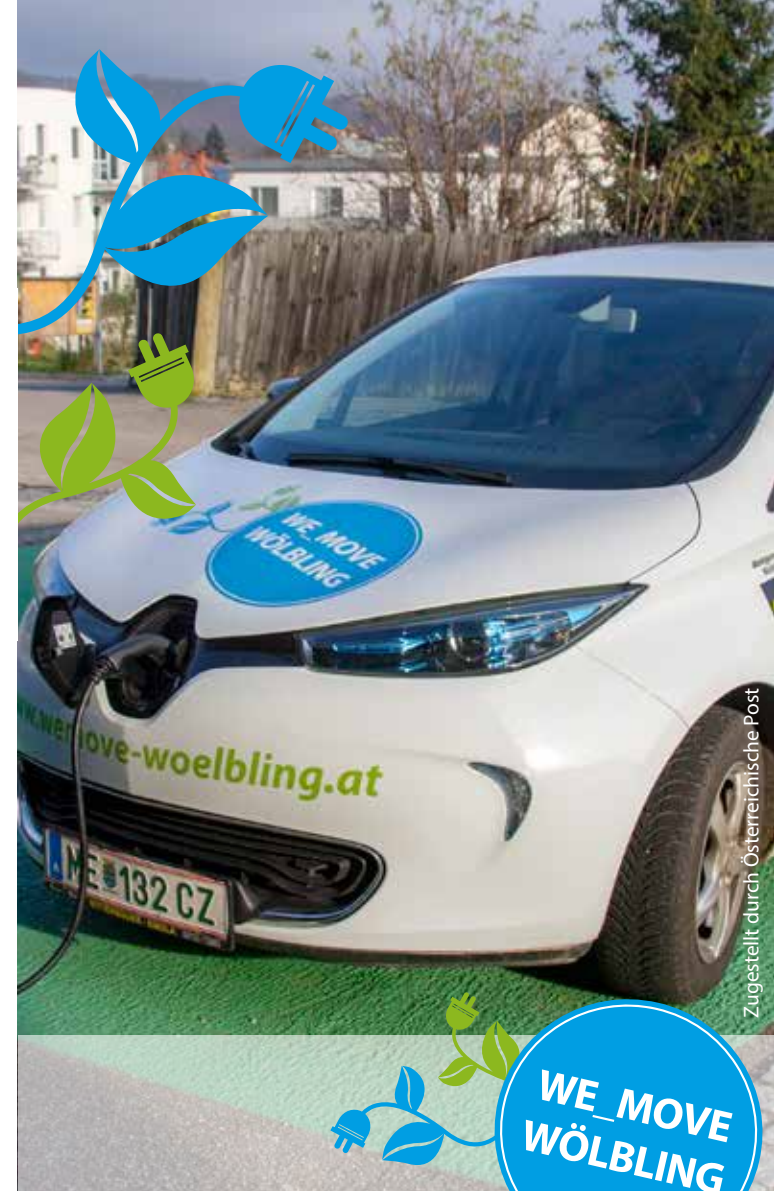
Zugestellt durch Österreichische Post

WE_MOVE ist maßgeblich davon abhängig, dass sich ausreichend ehrenamtliche Fahrerinnen und Fahrer finden, die mitwirken wollen. Fahren darf jedes Vereinsmitglied mit Führerschein der Klasse B (ausgenommen Probeführerschein). Natürlich bekommt jeder FahrerIn und jeder Fahrer eine Einschulung, um sich mit dem Auto vertraut machen zu können.